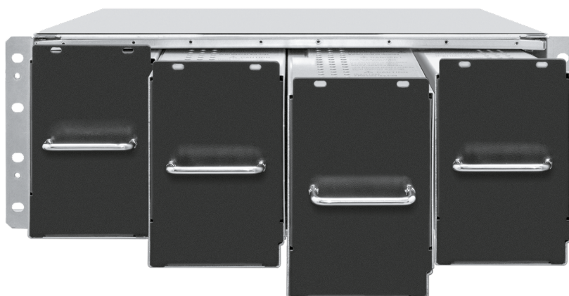
Батарейный модуль, напряжение 480В, емкость АКБ 9Ач